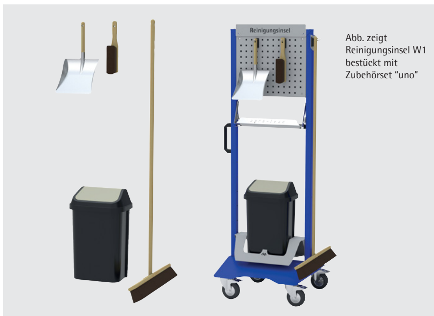
Abb. zeigt Reinigungsinsel W1 bestückt mit Zubehörset "uno"